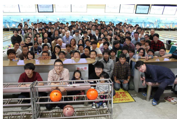
社内スポーツ大会でコミュニケーション活性化