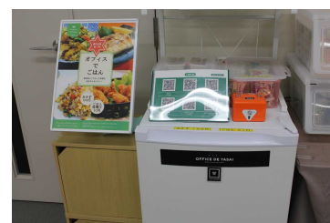
無添加・減塩・国産…こだわりの社食サービス